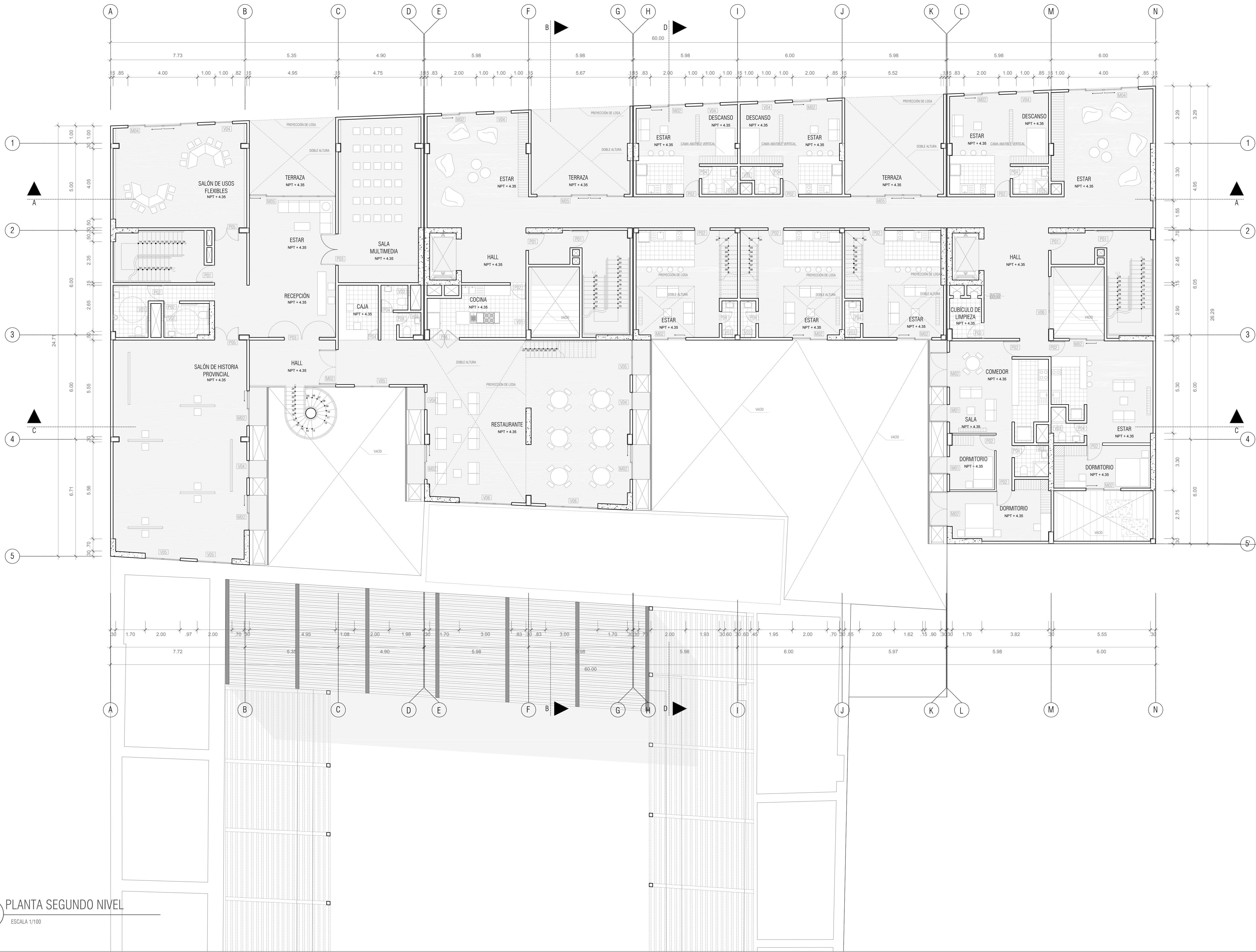
B PLANTA SEGUNDO NIVEL ESCALA 1/100